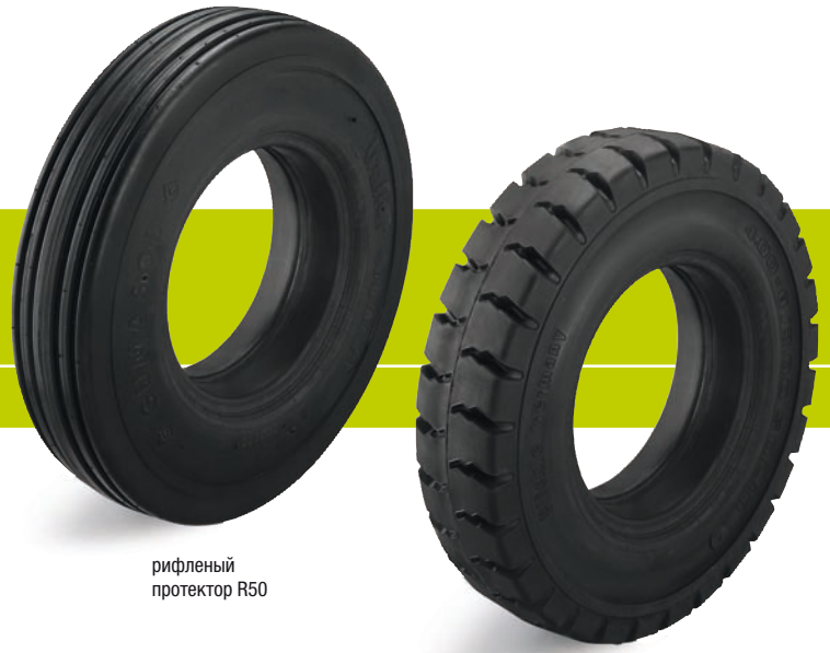
рифленый протектор R50